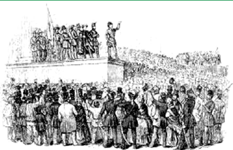
Ferész a Massam lapján a „Nemzeti dal” szócikán