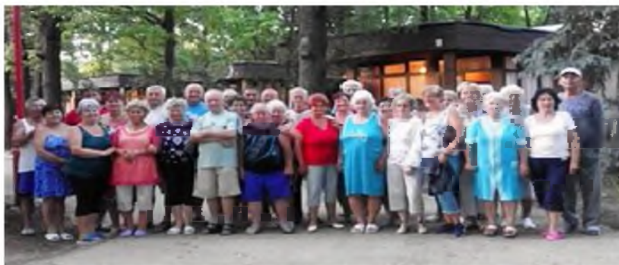
Mint minden évben, tavaly is kétszer voltunk Hajdúszoboszlón: