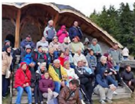
Voltunk egy hetet Erdélyben is: