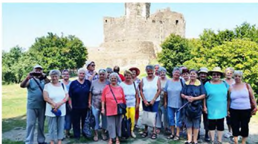
Egynapos kiránduláson bevettük Hollókő várát