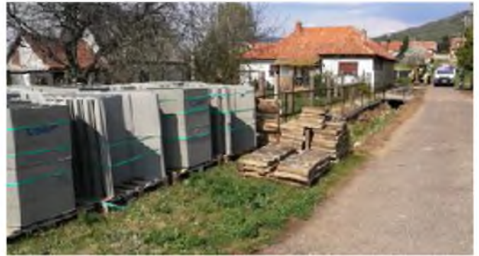
Révfy-part csapadékvíz elvezetés munkálatai.

Döntés született még 5 db új térfigyelő kamera telepítéséről, valamint elkezdődött az iskola melletti régi garázs felújítása, ezzel egy időben az iskola udvar kerítése, valamint a bölcsőde játszóudvar kerítése is megújul. A bezárt takarékszövetkezet Mária utca 2. szám alatti épületét az önkormányzat hatmillió