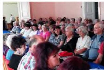
Megtartottunk az anyák napját, a Bányásznapot és aktívan részt vettünk települési rendezvényeinken.

2019-ben is a terveink már körvonalazódtak, a céljainkat kitűztük. és mi más kell hozzá, hogy megvalósítsuk?!